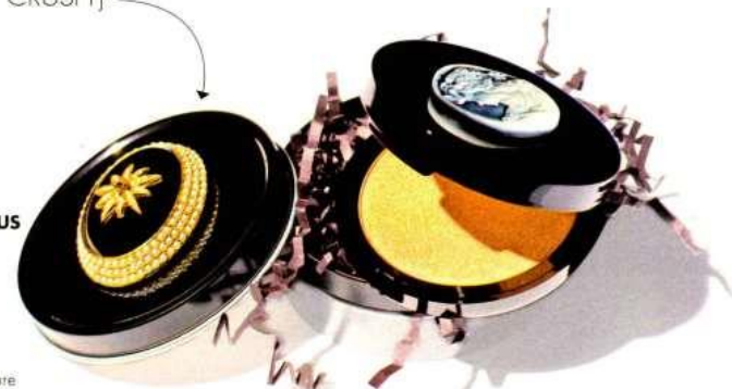
Adorn Me Illuminating Powder, n° 023, Edward Bess chez Dover Street Parfums Market, en édition limitée, 72 €.

11 L'ÉDITO Par Darothée Werner 12 TOUT CE QUI NOUS A RENDUS HEUREUX CETTE SEMAINE 14 LE QUESTIONELLE Thibault de Montalembert.