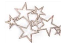
Atelier Swarovski by John Nolle Fermaglio per capelli