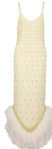
The Attico Abito con Swarovski e piume di struzzo