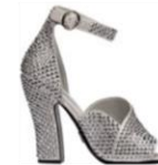
Prada Sandali in raso e cristalli