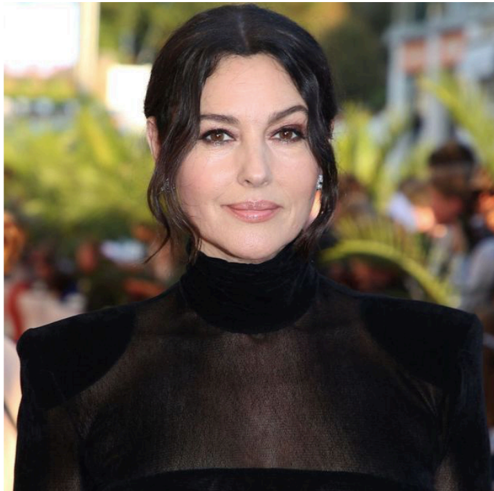
Monica Bellucci sublime avec son nouveau carré court à la Fashion Week de Milan