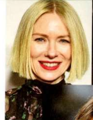
Sopra, Naomi Watts, 50, in medio-corto da circa un anno.