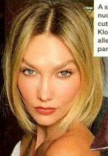
A sinistra, il nuovo bob cut di Karlie Kloss, 27, alle sfilate parigine.