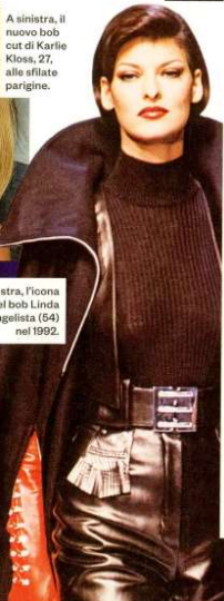
A destra, l'icona del bob Linda Evangelista (54) nel 1992.