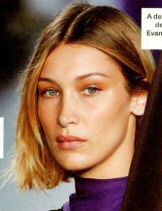
A destra, fresca di taglio midi anche la top Bella Hadid, 22.